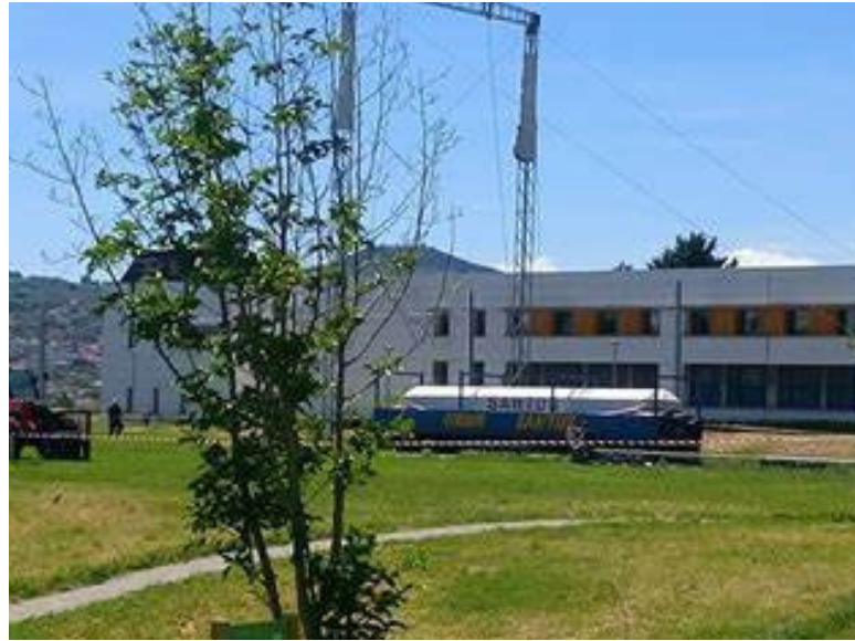
Maison de la vie étudiante Campus des Cézeaux

Maison de la vie étudiante 7 place Vasarely CS 60026 63178 Aubière Cedex