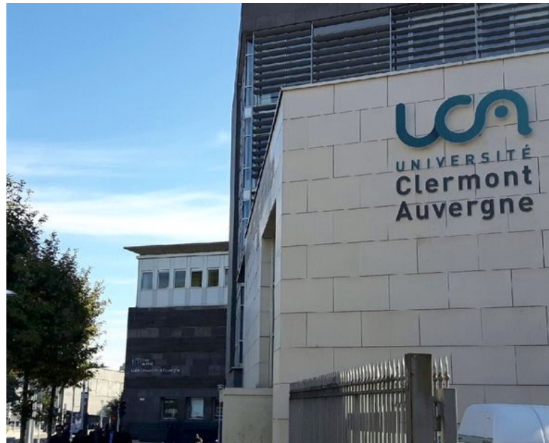
Direction de la Vie Universitaire

Contact : Direction de la Vie Universitaire 47 boulevard François-Mitterrand, 63000 Clermont-Ferrand Tel : 04 73 17 72 25 Mail : dvu@uca.fr